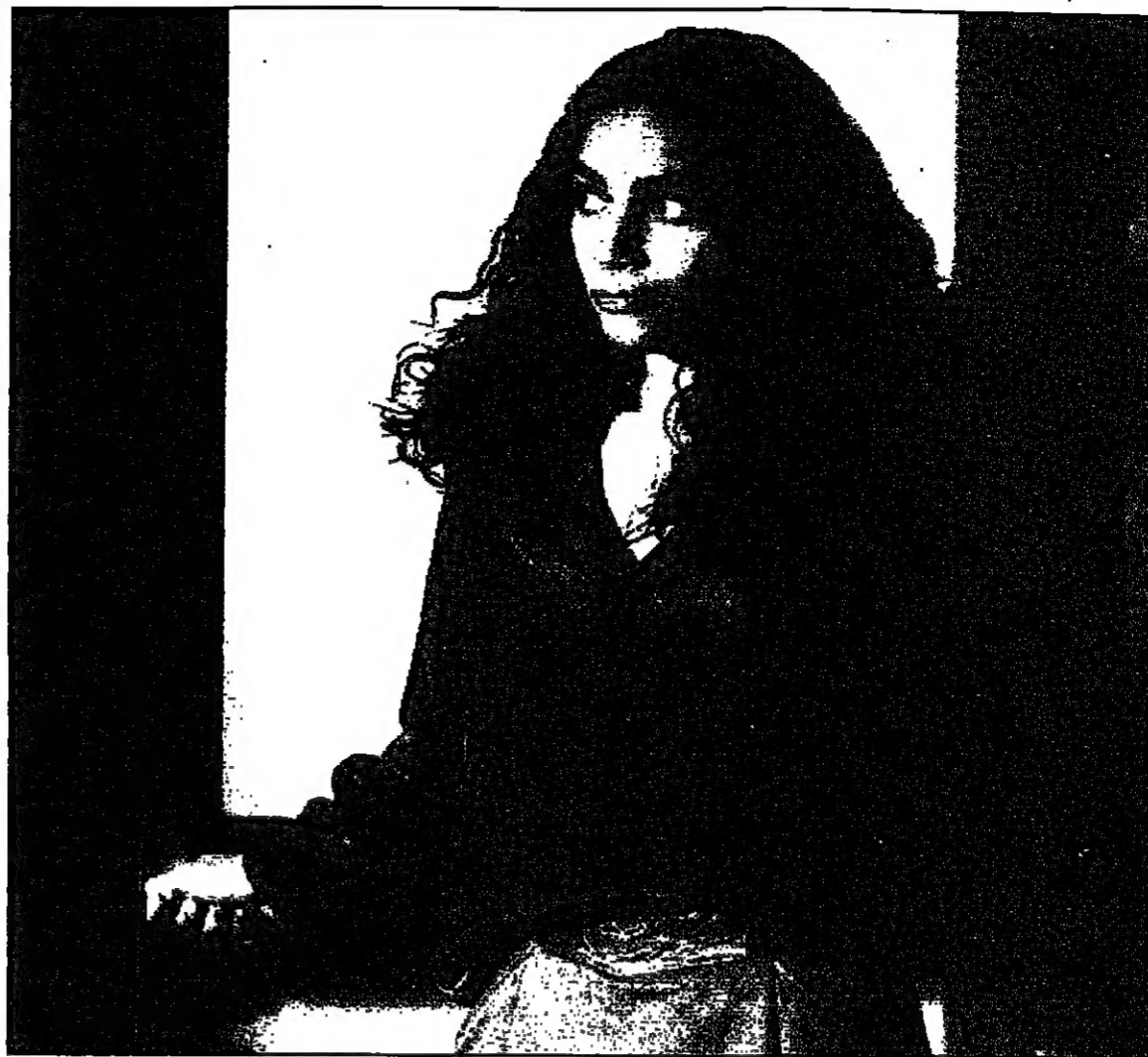
لغة من مسرحية «زوج على الورق» لحنان الشيخ (القدس العربي)